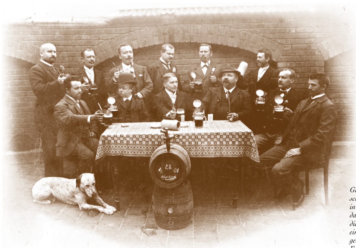
Gutbürgerliche Gesellschaft von Stammgästen in der Kitzmann-Bräu, dazu die Holzfässer, die sicherlich im Laufe eines geselligen Abends geleert wurden. Fotografie, um 1910.